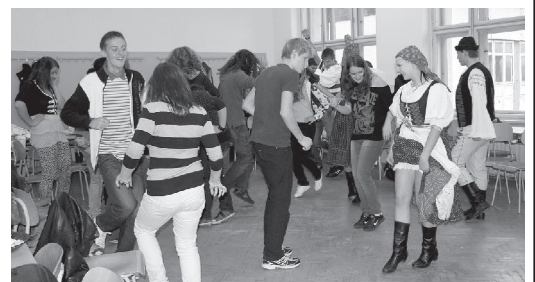
Folklórny súbor Váh to na tanečnom workshope poriadne rozprúdil

každému nepochybne zabráť, no aj napriek tomu hodnotia zúčastnení tento projekt na výbornú. Po skončení bolo každému jasné, že s našimi českými susedmi máme mnoho spoločného, a to nielen oblasti jazyka. Na záver stačí pridať jediné - my sme si rozumeli!