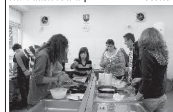
Medzinárodné varenie vyprážaných palacinek s bryndzou

V prvý deň študenti absolvovali mnoho aktivít zameraných najmä na odlišnosti a podobnosti české-