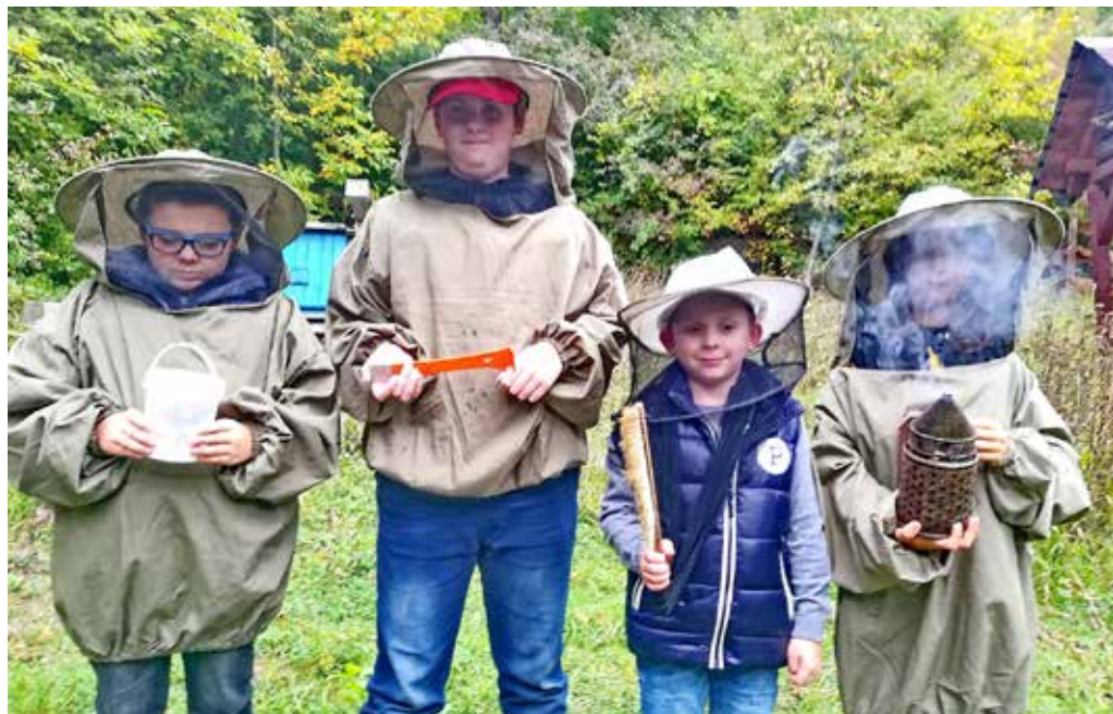
Členovia včelárskeho krúžku pri CVČ Včielka - mladší žiaci včelári pri prehliadke v múzeu včiel.

vystavené pôsobeniu pesticídov priamo počas zberu potravy. Čoraz viac sa objavujú chronické otravy, prejavujúce sa paralýzou, dezorientáciou a zmenami správania sa včiel, ktoré nastupujú po kratšom či dlhšom pôsobení daného prostriedku na ochranu rastlín.