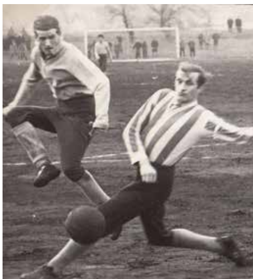
V zápale boja vo farbách Plzne. V jej drese strelil gól aj legendárnemu Ivovi Viktorovi.

„V Púchove sme mali výborné podmienky, na tú dobu takmer profesionálny funkcionársky tím. Ľudia boli pre futbal zapálení, a tak nečudo, že sme hneď v prvom roku postúpili zo štvrtého miesta do novovytvorenej Slovenskej národnej ligy. Stále som