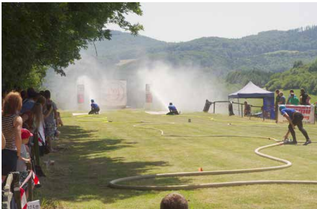
V jednom z najkrajších hasičských areálov - v Ihrišti, sa tento rok Slovensko-moravská hasičská liga neuskutoční. Súťaž možno odštartuje v júli.