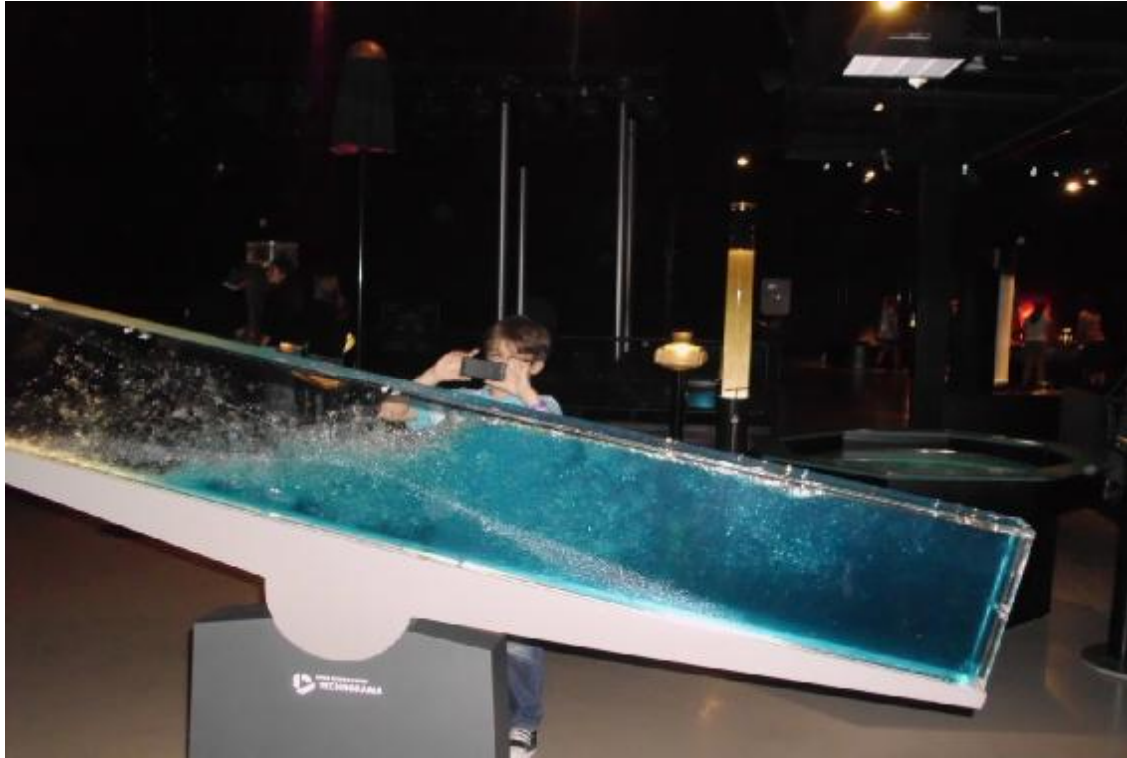
Technorama – turbulentné prúdenie kvapaliny