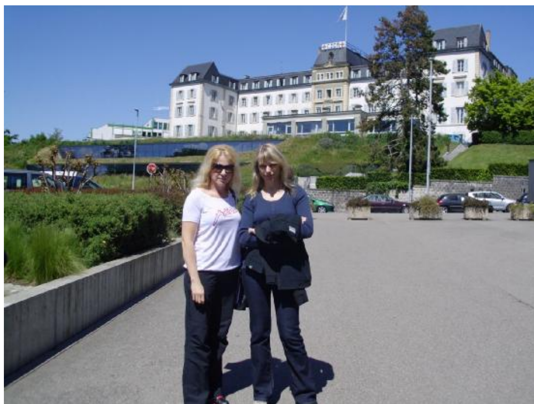
Hore - povestná stolička v Ženeve, dolu - fotografia pred OSN, v pozadí budova Červeného kríža