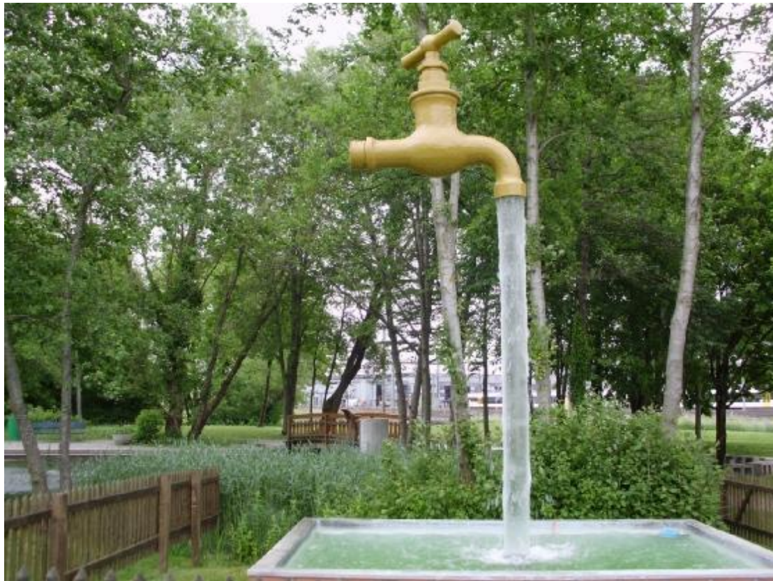
...to by sa hodilo do záhrady...