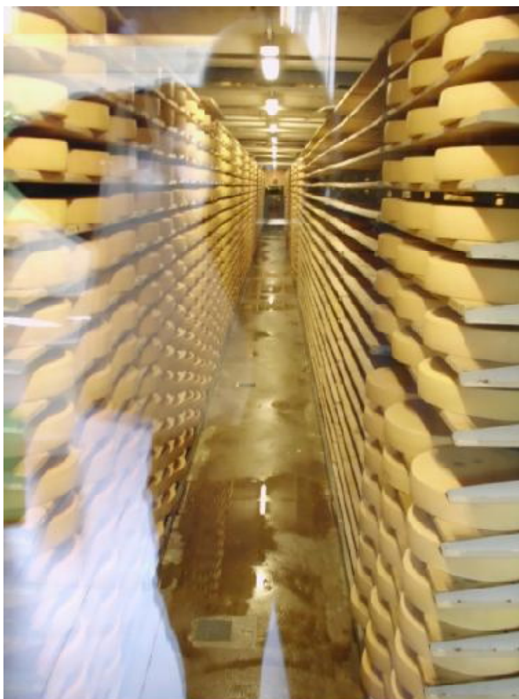
Oddelenie, v ktorom zrejú syry Le Gruyere aj 14 mesiacov