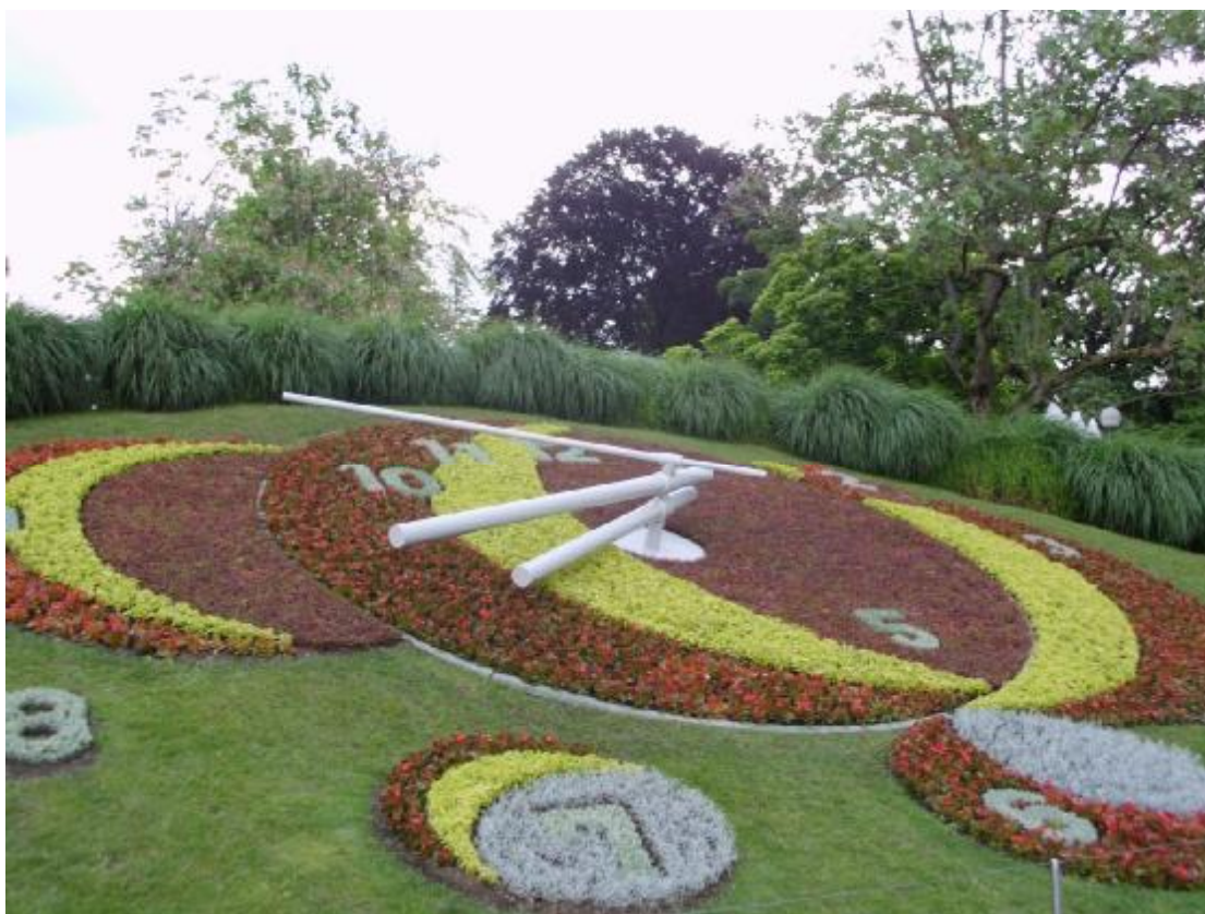
Slnečné hodiny v Ženeve