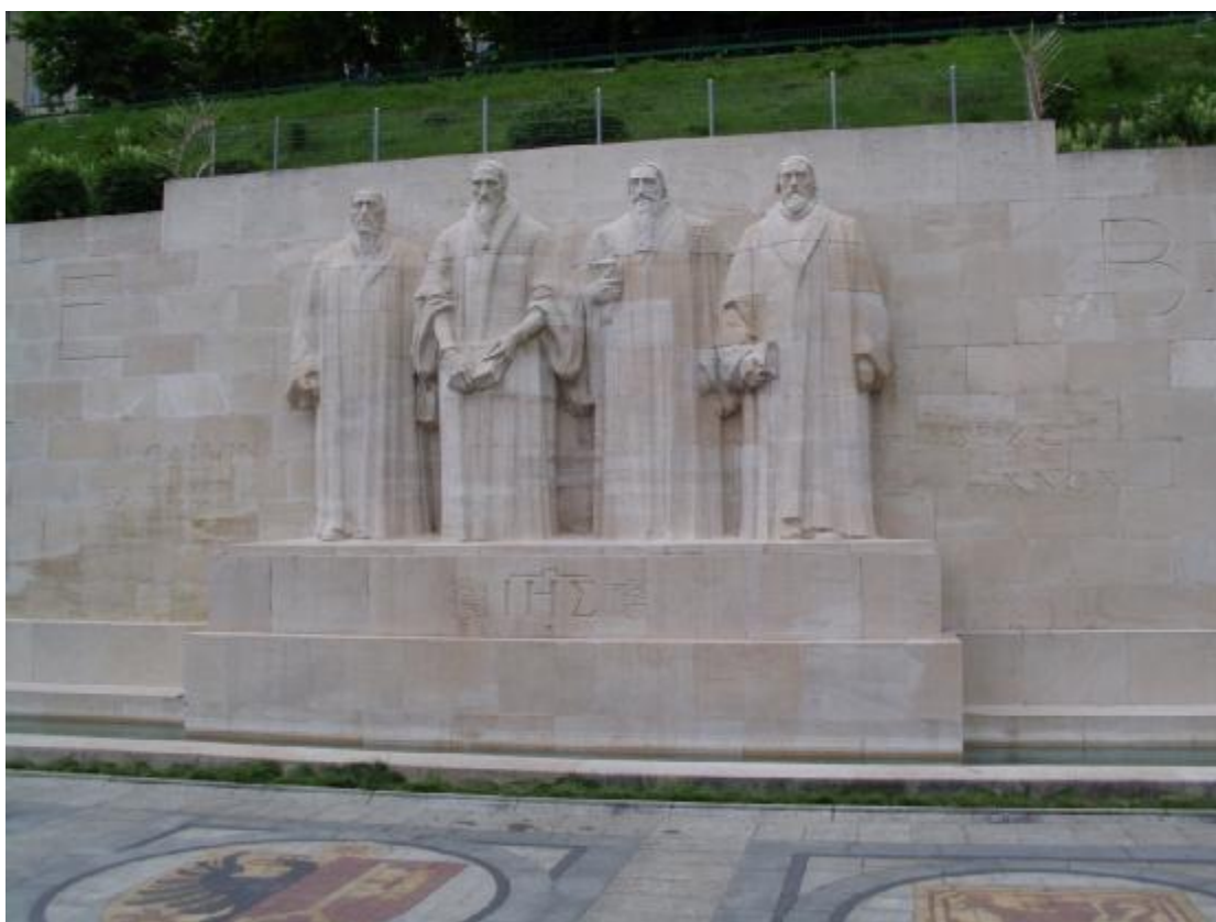
Pamätník švajčiarskym cirkevným reformátorom