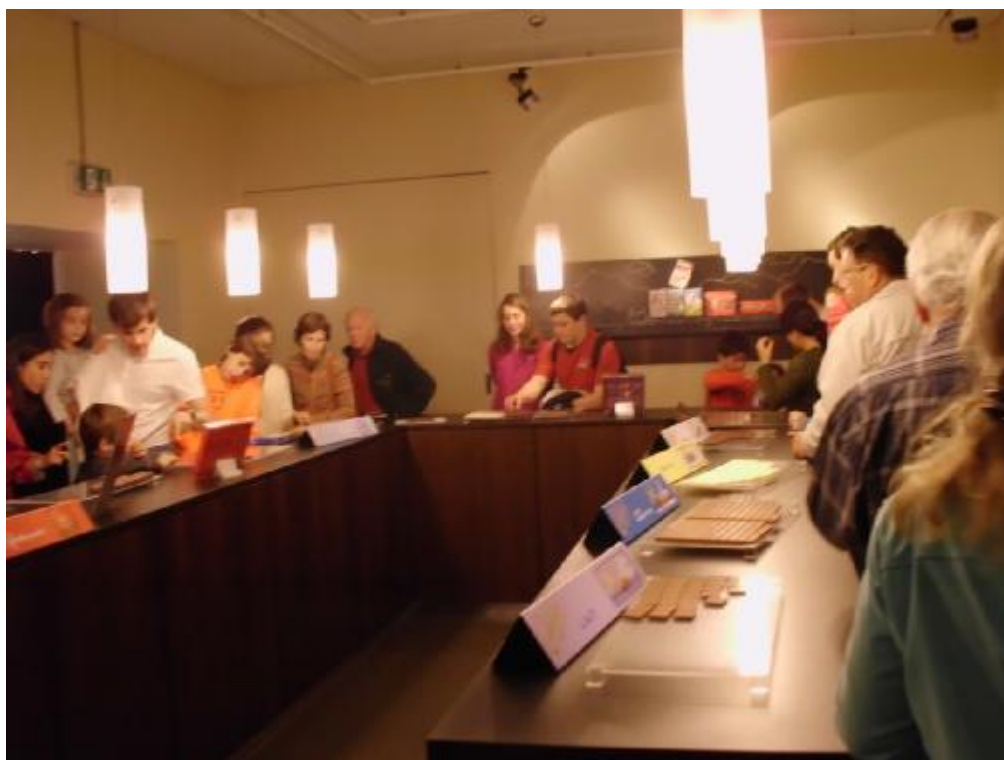
Obľúbená ochutnávka čokolády v Čokoládnovni La Maison Cailler