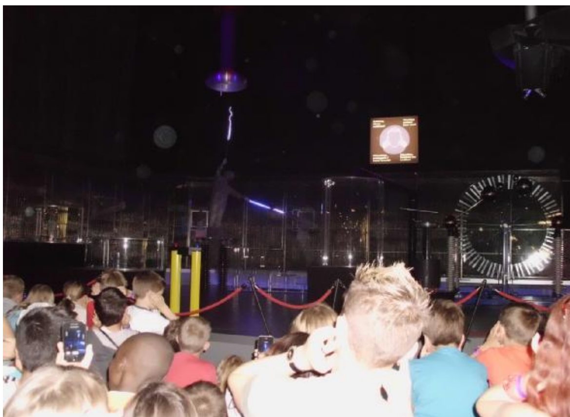
Technorama – muž vo Faradayovej kletke