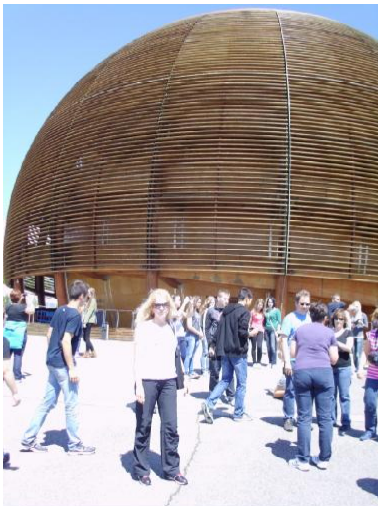
Múzeum Globe v Cerne