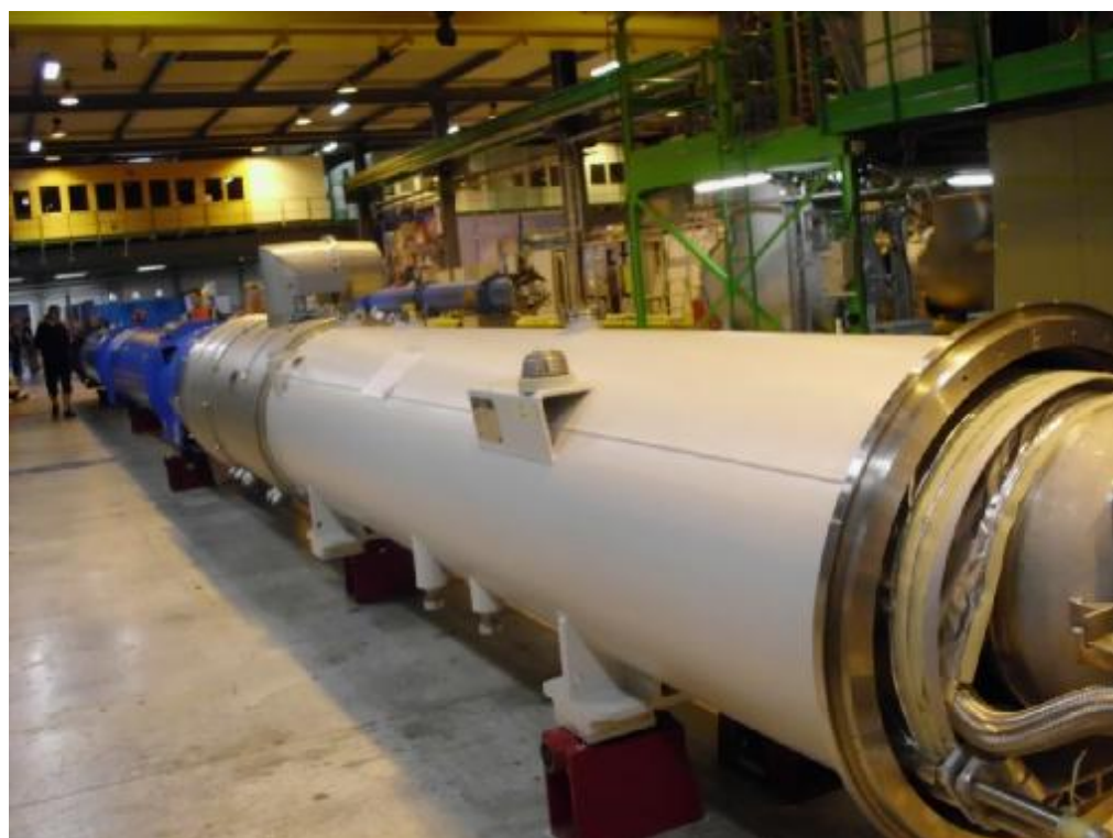
Reálny model urýchľovača častíc