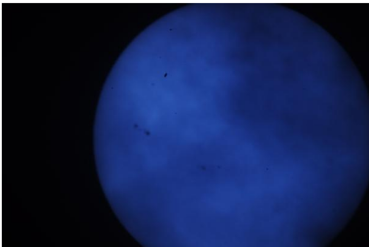
Slnko cez modrý filter