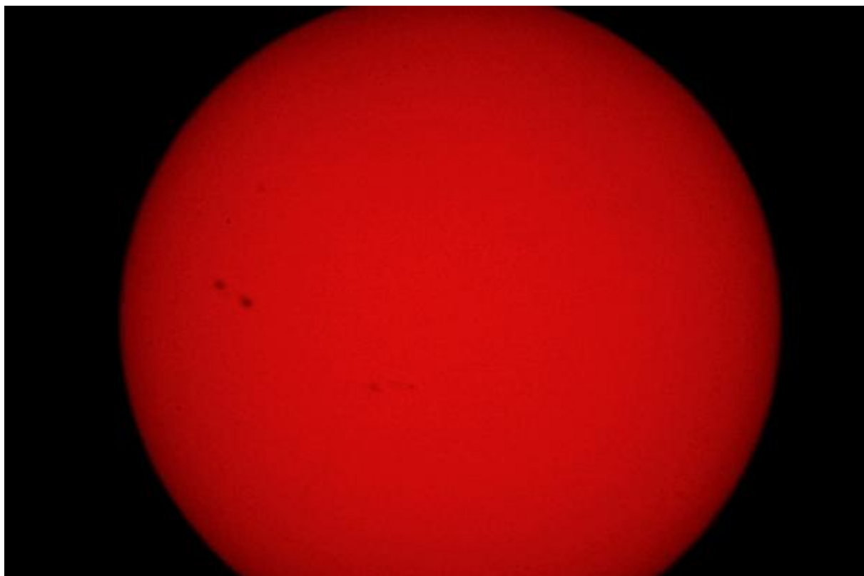
Slnko cez červený filter