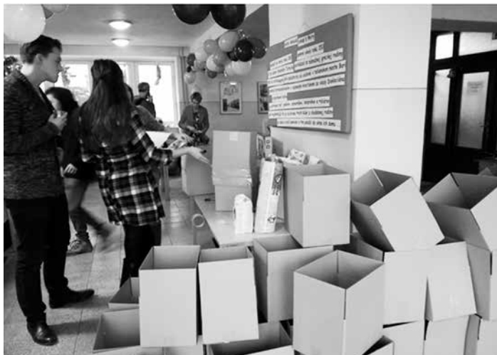
Do všetkých týchto škatúl putovali darčeky, ktoré nakúpili triedy z gymnázia.