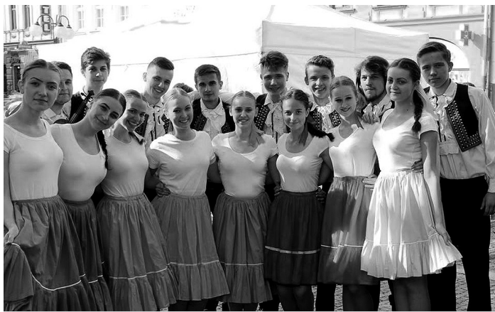
Hľadajte gympľakov :-)

rodičia ako dieťa zapísali na husle a v ZUŠ-ke som začal chodiť do súboru.