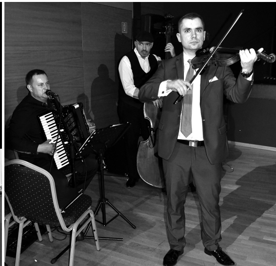
Obľúbené "Trio Carpatia".

Dňa 10. februára 2018 sa vo večerných hodinách vo veľkej sále púchovského divadla stretli učitelia, absolventi, rodičia študentov, študenti a priatelia nášho gymnázia, aby si vychutnali už v poradí 27. gymnaziálny ples, plný dobrého jedla, tanca, hudby a príjemných rozhovorov.