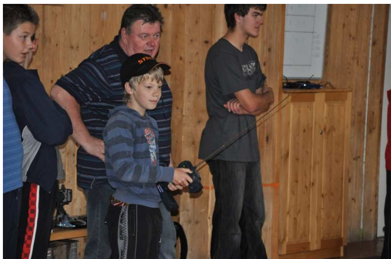
Autodrom v telocvični