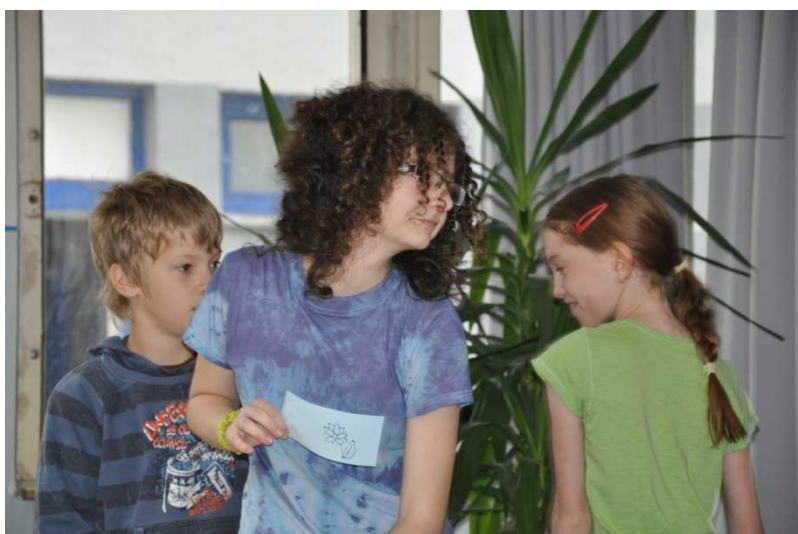
Lepenie obrázkov na zoznamovaciu tabuľu