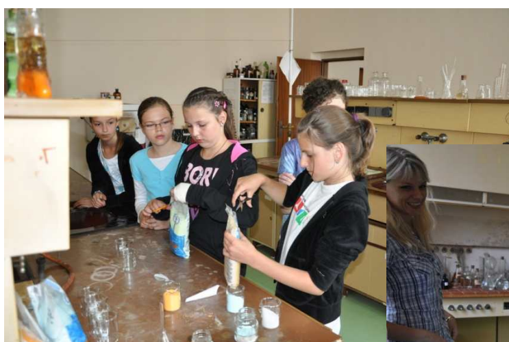
Vytváranie slanej krajinky vo fľaštičke