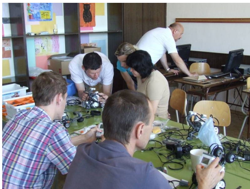
Spoločné vzdelávanie učiteľov informatiky o konštrukcii a programovaní robotov