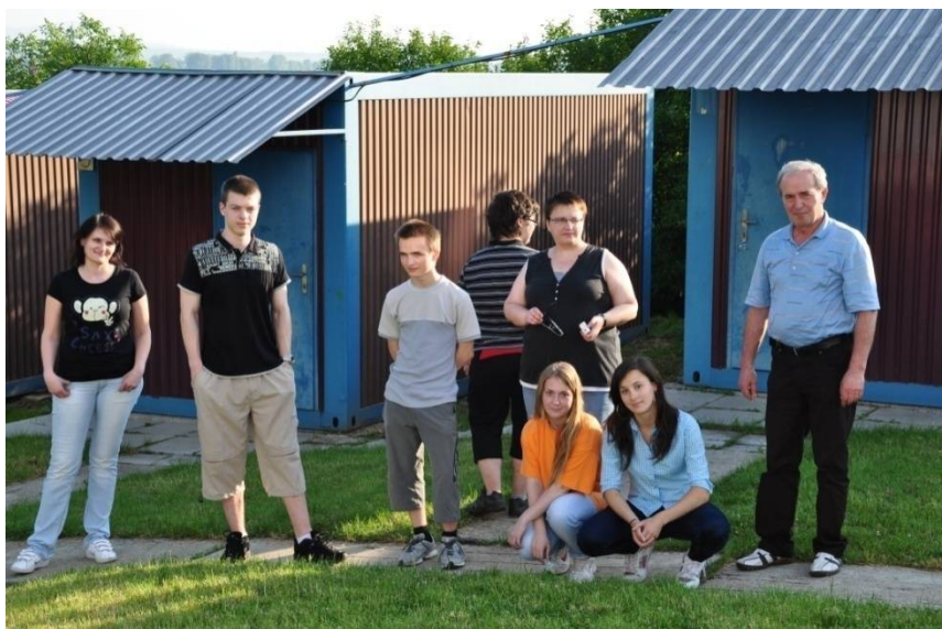
Účastníci spoločného pobytu vo hviezdárni pri Partizánskom