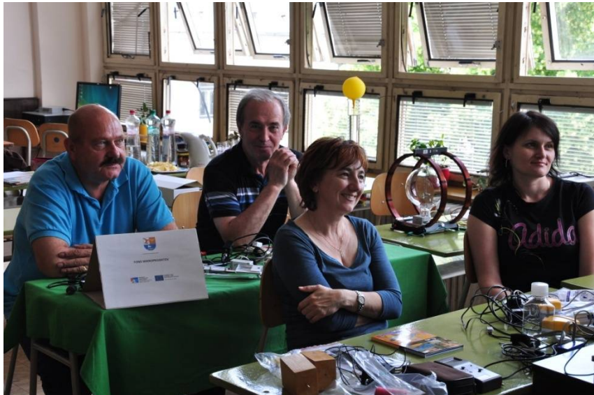
Vzdelávanie učiteľov oboch škôl o pokusoch so systémom COACH 6