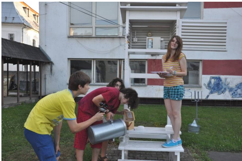
Sledovanie počasia pomocou zariadení meteorologickej stanice