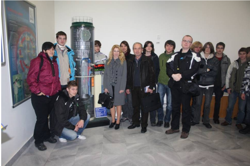
Exkurzia do atómovej elektrárne v Jaslovských Bohuniciach