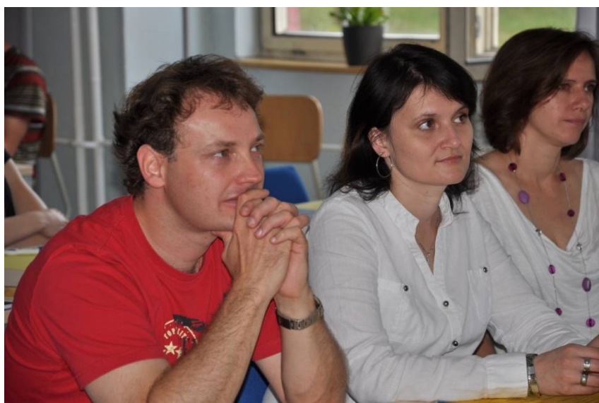
Kolegovia z družobnej školy na konferencii