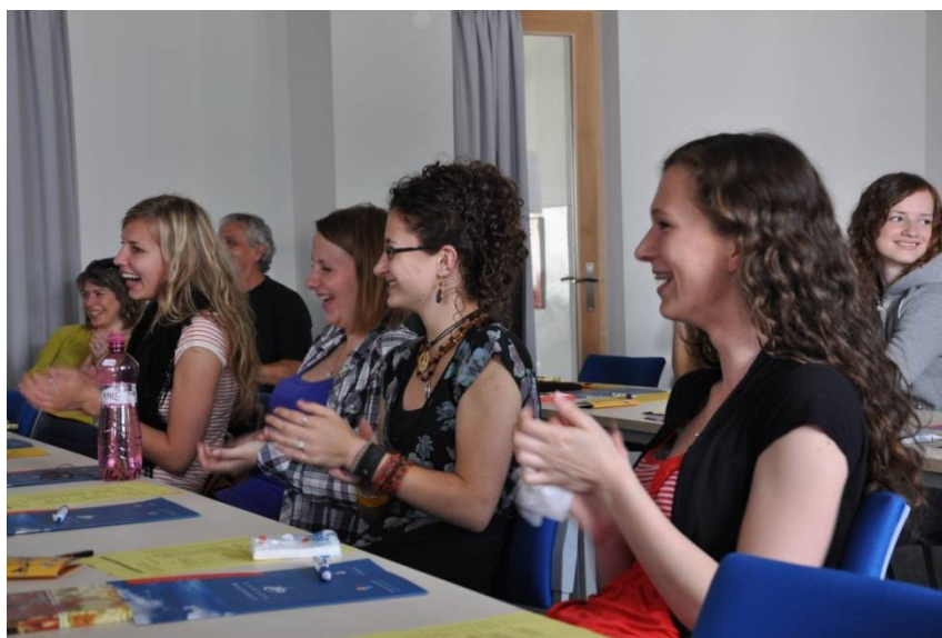
Niektoré príspevky účastníkov konferencie boli nielen odborné ale aj nadmieru zábavné