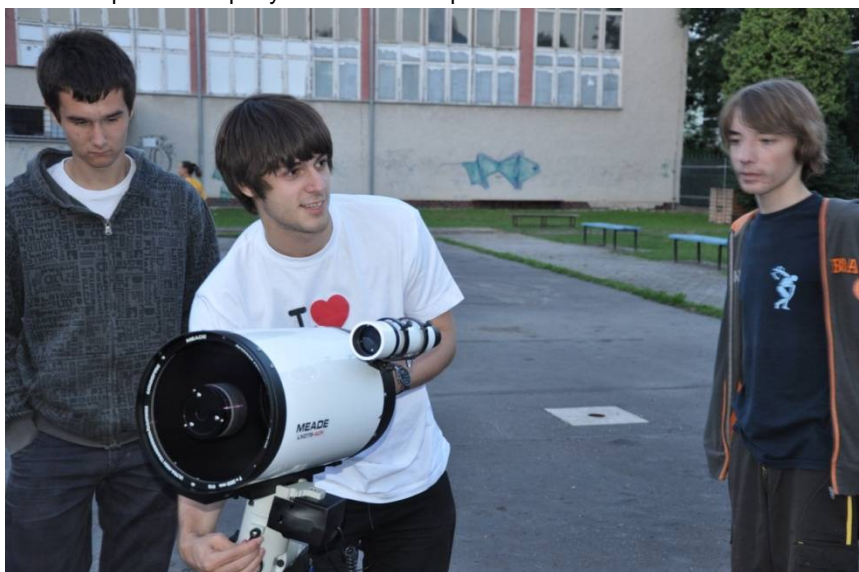
Príprava na pozorovanie oblohy novým ďalekohľadom