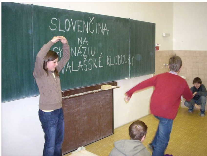
Výmena učiteľov slovenčiny a češtiny medzi Gymnáziom Púchov a Gymnáziom Valašské Klobouky