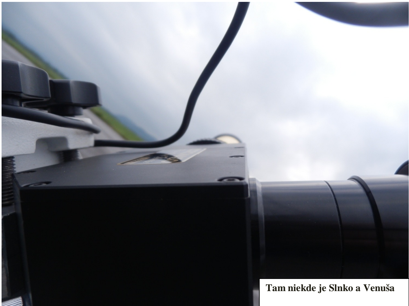
Tam niekde je Slnko a Venuša