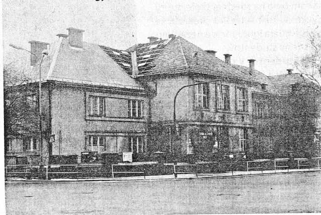
Hlavná budova gymnázia na snímke s pred 50 rokov.