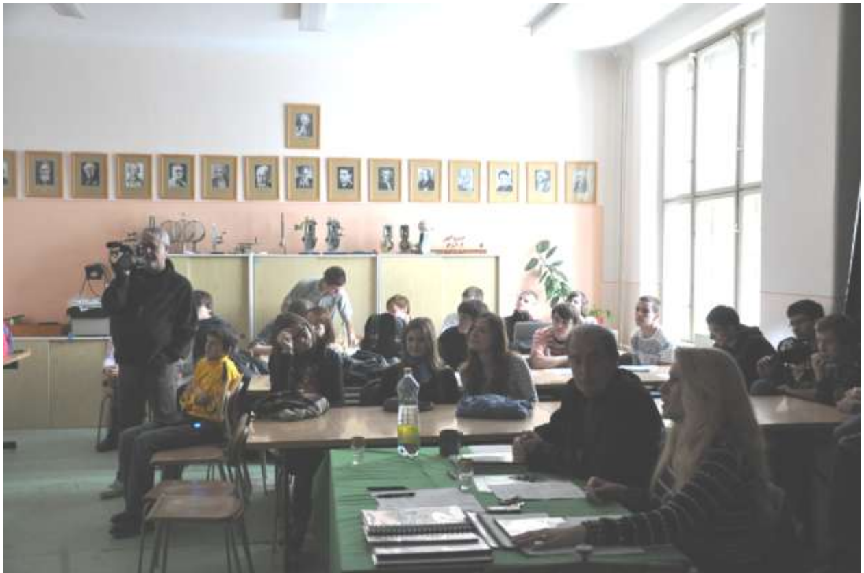
Porota a obecenstvo na obhajobách projektových prác z fyziky