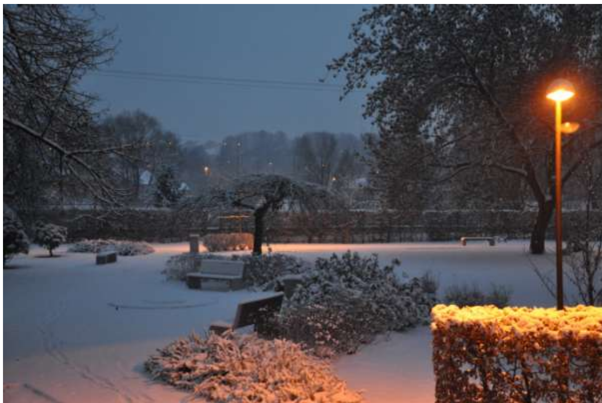
Ráno pred obhajobami bolo skutočne čarovné.